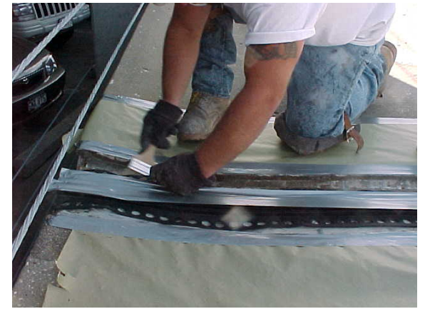
6. Asegúrese que el primer esté bien aplicado debajo de las alas.