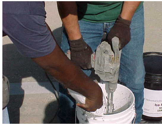
8. Mexclar componentes durante 1 minuto.