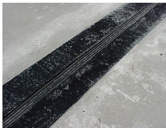
14. Instalacion Completa.