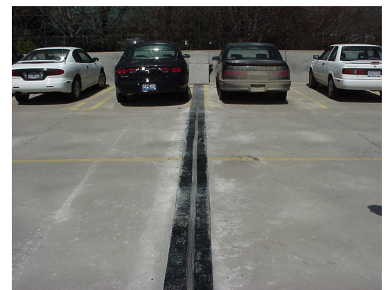
15. Junta de expansion funcionando.