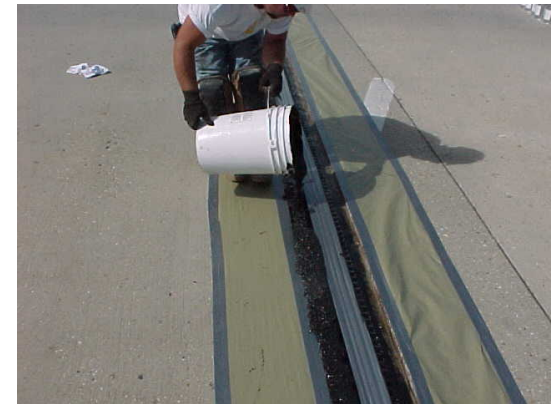
12. Aplique el producto 900 sobre la superficie del las alas.