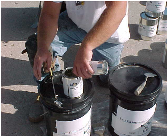
4. Mezclar dos componentes Primer #10.