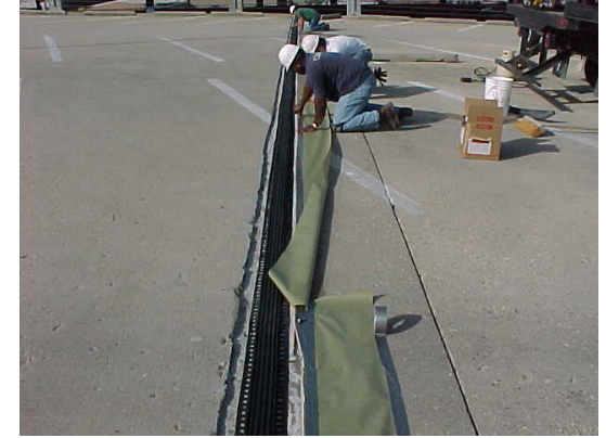
3. Proteger el área de trabajo en ambos lados de las alas.