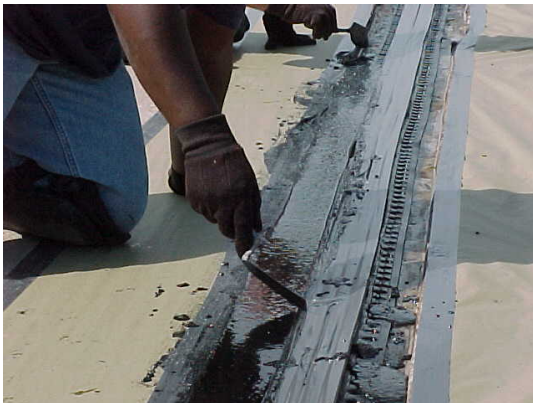
13. Acabar superficie con la paleta hasta lograr que se alise la superficie.