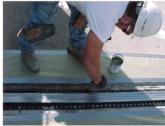
5. Aplicar primer con brocha debajo de alas y en el concreto.