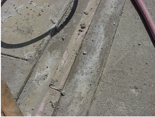
1. Preparacion de superficie.