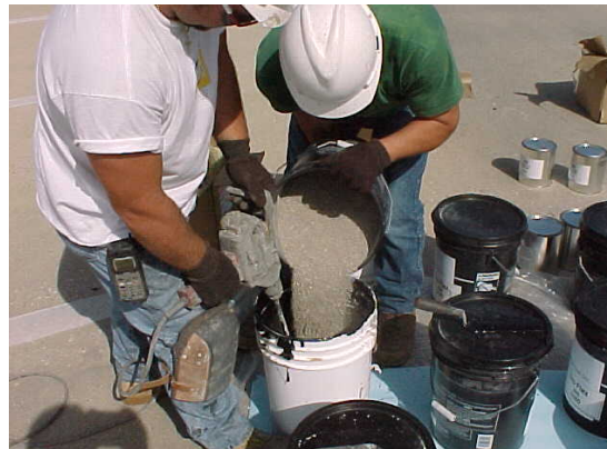
11. Agregue componente C (arena) y siga mesclando hasta lograr una consistencia uniforme.