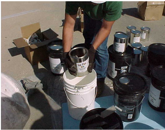
7. Escele las dos partes de tack coat #910.