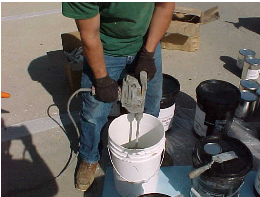
10. Primermente mescle los components A+B de los liquidos 900.